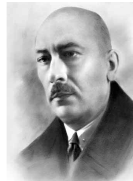
Рис. 1. А.А. Миллер. Начало 1930-х гг.

На родине ученого археологии и этнографии обучали только в университетах, но в России в соответствии с университетским уставом 1884 г. право поступления в эти учебные заведения предоставлялось лишь лицам, окончившим гимназию или приравненное к ней образовательное учреждение 4 . А.А. Миллер получил среднее образование в одном из кадетских корпусов, целью которых было «доставлять малолетним, предназначенным к военной службе в офицерском звании и преимущественно сыновьям заслуженных офицеров, общее образование и соответствующее их предназначению воспитание» 5 , что исключало возможность приравнивания кадетского корпуса к гимназии. Инженерное училище, полный курс которого окончил А.А. Миллер, также не имело гимнази-