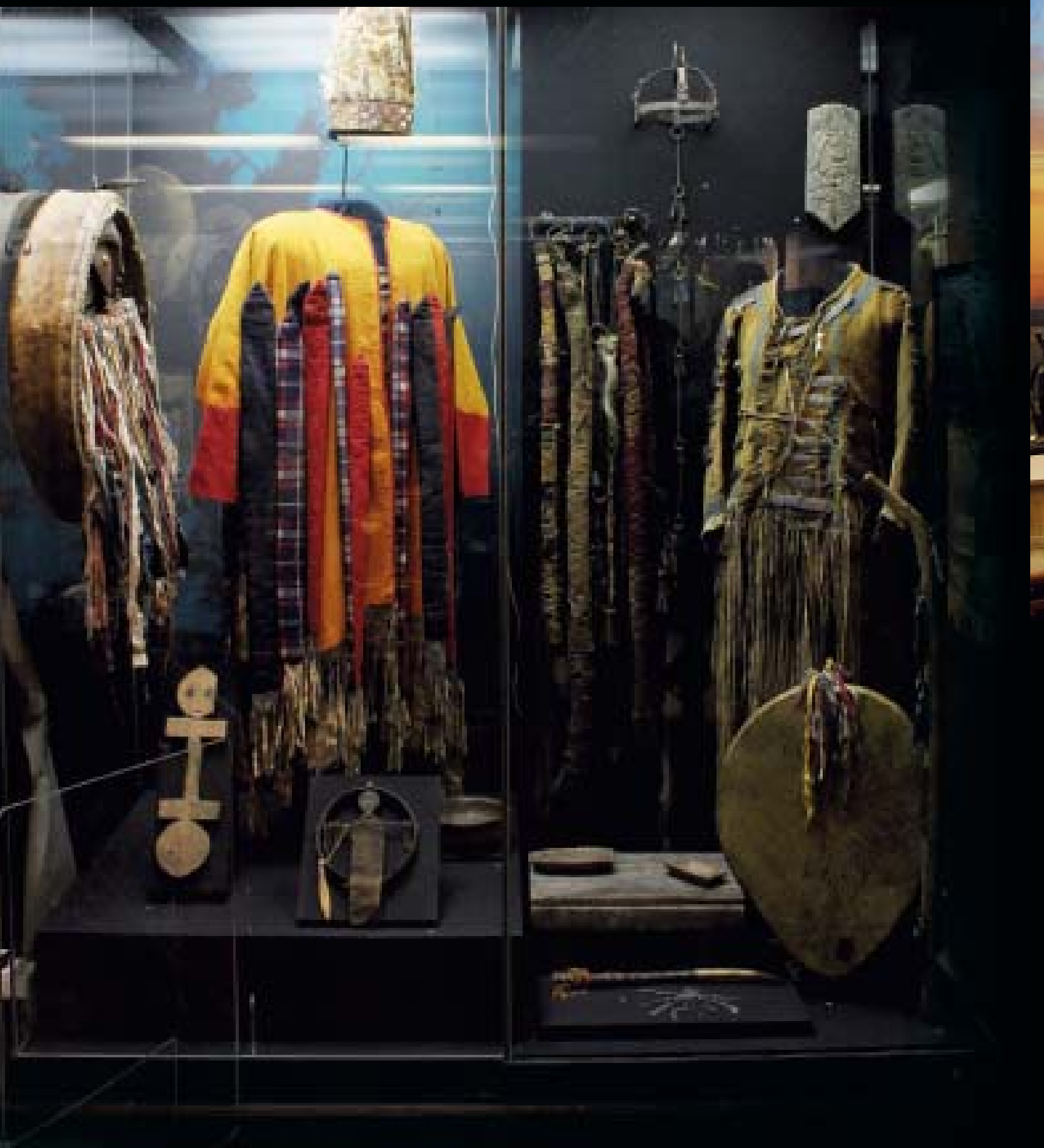
Илл. 5. Витрина «Шаманство народов Южной Сибири»