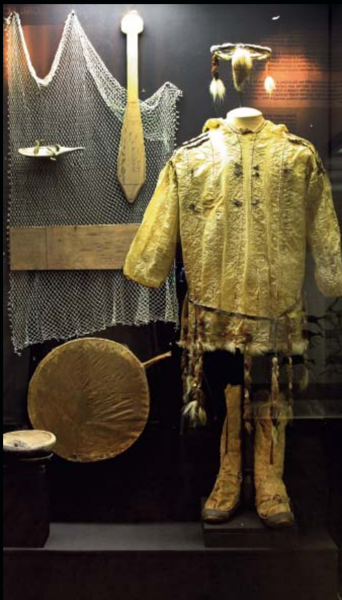
Илл. 2. Витрина «Праздник Кэрэткуна у морских зверобоев Чукотки»