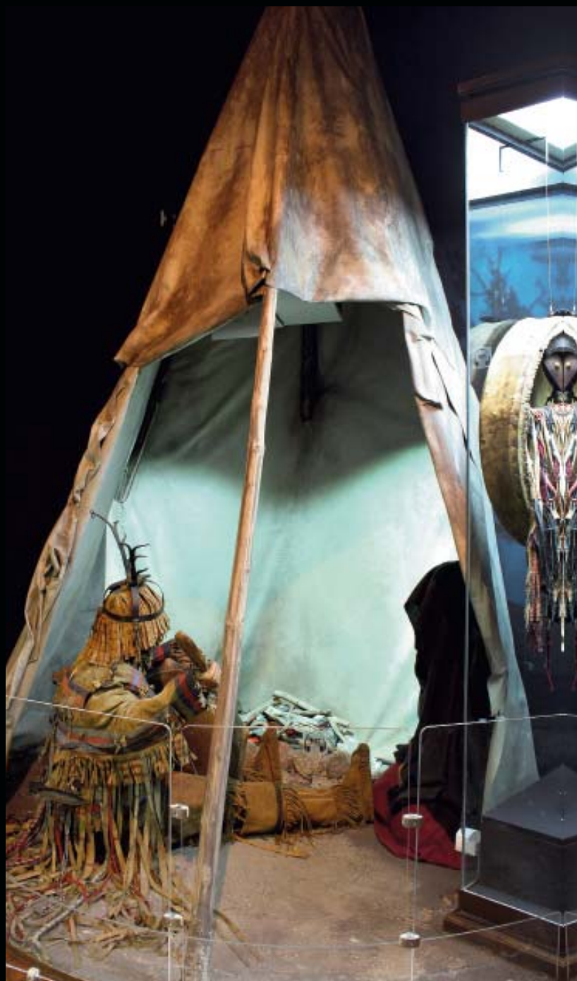
Илл. 4. Макет «Камлание шамана»