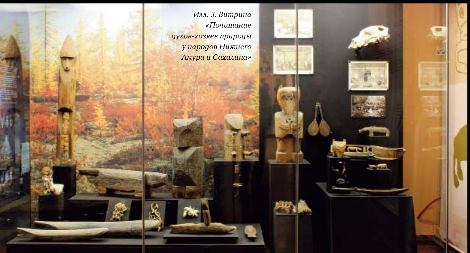
Илл. 3. Витрина «Почитание духов-хозяев природы у народов Нижнего Амура и Сахалина»