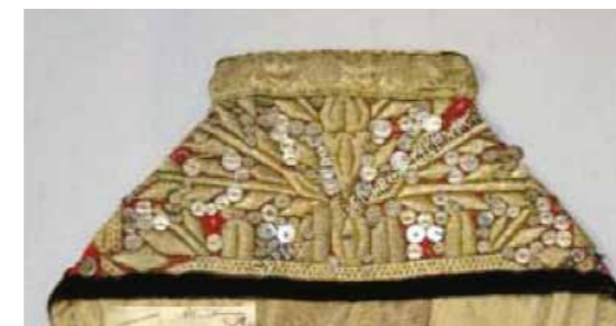
ПРЕДМЕТЫ ИЗ КОЛЛЕКЦИЙ, СОБРАННЫХ Д.Т. ЯНОВИЧЕМ

Генеральная прокуратура Республики Казахстан. Управление Комитета по правовой статистике и специальным учетам по Карагандинской области. – Архивное личное дело заключенного НР 171225 (29060); Акт № 4 от 18 января 1940 г. о смерти Д.Т. Яновича; Акт от 18 января 1940 г. о захоронении на кладбище лаготделения Сарепт.