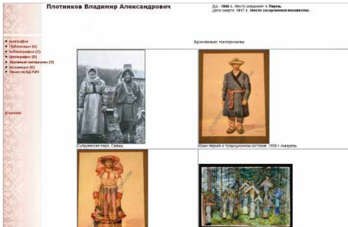
Отображение архивных материалов из коллекции В.А. Плотникова в БД «Электронный биобиблиографический словарь "Собиратели Российского этнографического музея"»