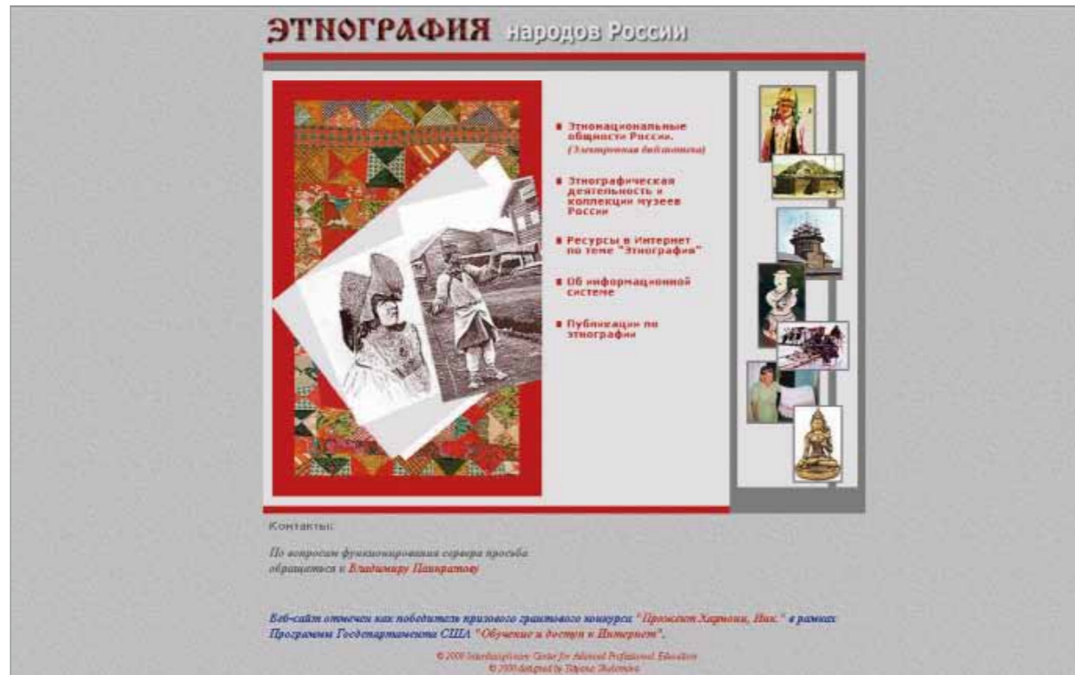
Главная страница веб-сайта «Этнография народов России». Все БД РЭМ находятся в разделе «Этнографическая деятельность и коллекции музеев России»