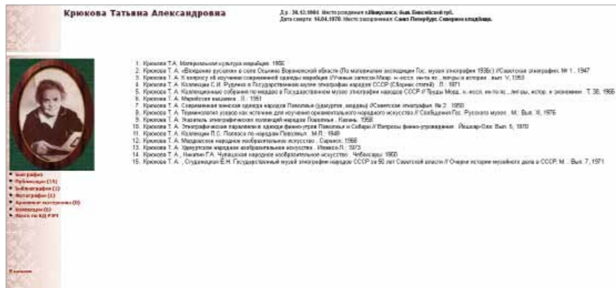
Список публикаций Т.А. Крюковой в БД «Электронный биобиблиографический словарь «Собиратели Российского этнографического музея»»

1 О различных аспектах освоения музеями новых технологий свидетельствуют конференции АДИТ («Автоматизация деятельности музеев и информационные технологии»), организуемые с 1998 г. URL – Режим доступа: adit.ru. В качестве примера приведу традиционный раздел одного из сборников материалов этих конференций: «Информационные технологии в музее, АДИТ-клуб «Казань» // Музей и общество: современные модели интеграции: Мат. Межд. музейного форума в Казани 14–18 сентября 2010 г. / Отв. ред. С.Ю. Измайлова. В 2-х т. – Казань: Фолиант, 2011. – Т 2. – С. 7–25. Оценку состояния информационных технологий в музеях РФ см. публикации Л.Я. Ноля.