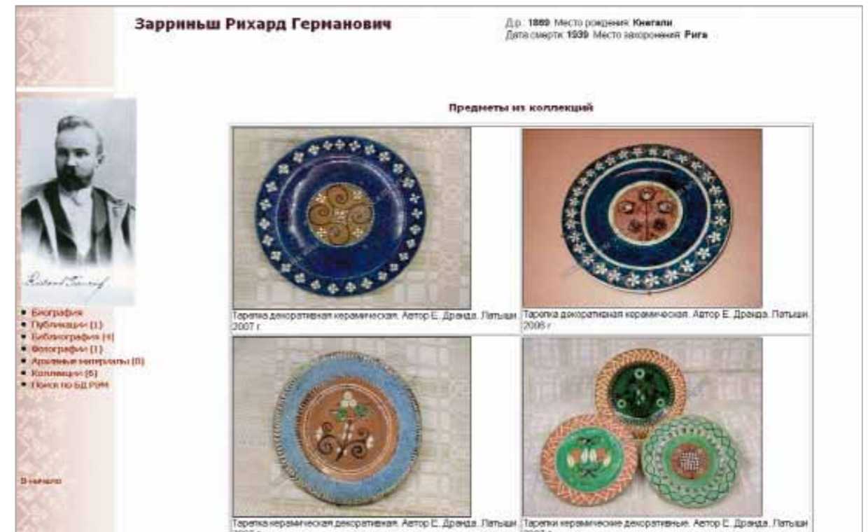
Отображение предметов из коллекций Р.Г. Зарриņша в БД «Электронный биобиблиографический словарь "Собиратели Российского этнографического музея"»