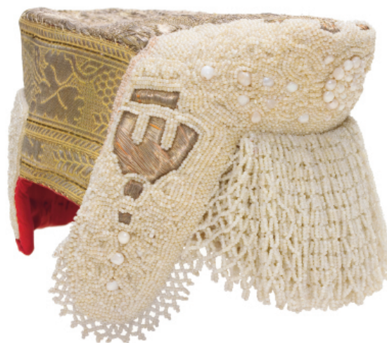
Рис. 1. Кокошник. Олонецкая губ., Каргопольский у., Нифантовская вол., д. Савино. Русские. РЭМ 1569-1.

Поднесенный головной убор (рис. 1) представляет собой тщательно выполненный кокошник каргопольского типа, имеющий форму твердой шапочки с овальным плоским донцем, т-образным задником, «паушами», слегка выдающимся вперед очельем и спускающейся на лоб в несколько рядов бисерной поднизью на уплотненной ватой (?) и простеганной хлопчатобумажной подкладке. В его основе жесткий картонный каркас, который изнутри обшит кумачом, а снаружи — широкими полосами позумента, уложенными вдоль бортов и поперек донца. Задник, пауши и очелье украшены саженым по бели мелким стеклянными бисером желтоватого оттенка и перламутровыми плашками. На очелье — тонко обозначенная рядами бисера традиционная пятилопастная фигура с розеткой из плашек посередине; на паушах — трезубчатый орнамент, вышитый золотой нитью. По материалу и отделке головной убор является типичным для центральных волостей Каргопольского уезда 3 , к которым с запада примыкала Нифантовская волость. Место его изготовления — д. Савина-Ляга (Савино) входило в Полуборский Георгиевский приход и располагалось в 12 верстах к северу от г. Каргополя по дороге к Ошевенскому монастырю. Среди 12 деревень Полуборского общества эта деревня была наиболее крупной, насчитывала 54 двора, 59 семейств общей численностью в 385 человек 4 . Только 3% деревень Каргопольского уезда