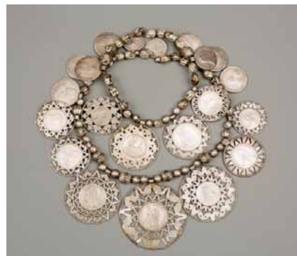
Рис. 2. Ожерелья паатер. РЭМ 2615-5; 2615-6. Эстляндская губ., XIX век. Серебро Полтины и рубли Российской империи XVIII века; талеры государств Священной Римской империи германской нации XVII века; монета Республики соединенных провинций Нидерландов 1762 года; имитации российских и западноевропейских монет