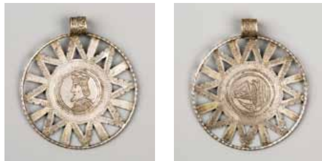
Рис. 13 а, б. Подвеска работы В.А. Трюля. РЭМ, 6697-88. XIX век. Серебро