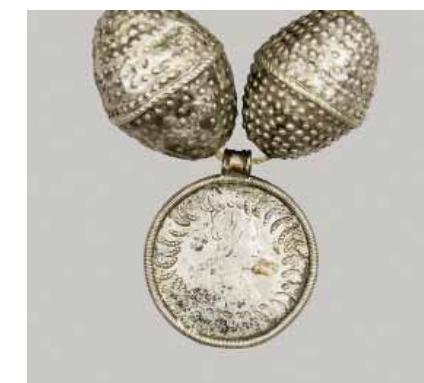
Рис. 10. Монета-подвеска «с ушком». РЭМ, 6697-42. XVIII–XIX века. Рубль-крестовик Петра II (1728). Серебро