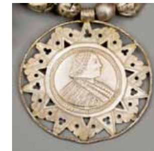
Рис. 6 а, б. Подвеска работы М.В. Бракманна. РЭМ, 2615-5. XIX век Серебро