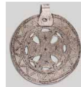
Рис. 5. Подвеска паатер. XV–XVI века. Цветной металл. Собрание Эстонского национального музея: ERM A 509:6631, Eesti Rahva Muuseum, http://www.muis.ee/museaalview/501336