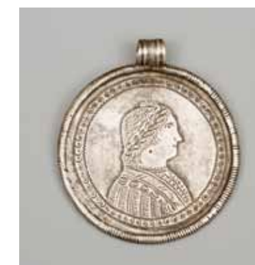
Рис. 11 а, б. Подвеска работы М.В. Бракманна. РЭМ, 6697-100. XIX век. Серебро