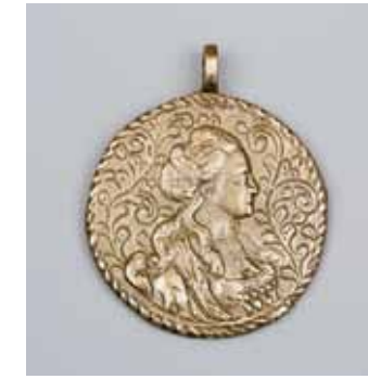
Рис. 16. Дукач. РЭМ, 6697-175. XIX век. Цветной металл