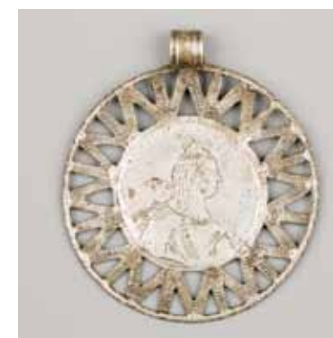
Рис. 9 а, б. Монета-подвеска «со спицами». РЭМ 6697-85. XIX век. Вольная интерпретация портрета императрицы на полтине Екатерины II 1863 г. Серебро