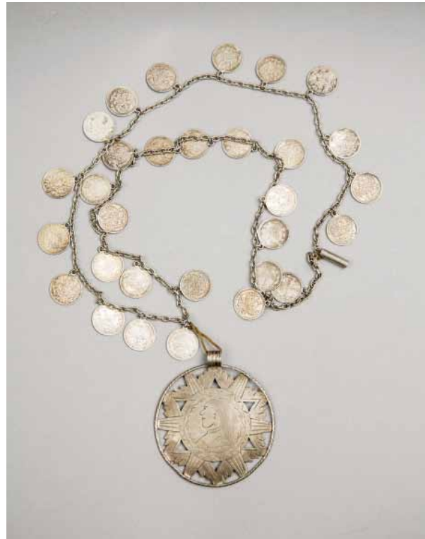
Рис. 14. Фрагмент ожерелья. РЭМ, 6697-12. Подвеска работы В.А. Трюля. XIX век. Серебро