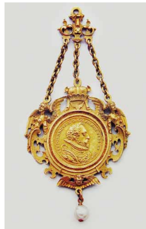
Рис. 15. Гнаденпфеннинг. Медаль: Бавария, около 1650 года. Оправа: предположительно XIX век. Золото. Musée National de la Renaissance, Escouen. Публикация: Idol und Ideal. Das Bild des Menschen im Schmuck der Renaissance. Ausstellungskatalog, Schmuckmuseum Pforzheim, 1997. – 11

ского императора-реформатора – характерная прическа, лавровый венок, форма носа, усы (рис. 6 а). На оборотной стороне таких подвесок мастер помещал не гербового орла или крестообразно расположенные вензеля императора, а подобие эмблемы лучезарного солнца (рис. 6 б, 11 б). В круг вписан четырехконечный крест, между лопастями которого расходятся лучи, а в средокрестии находится схематичное изображение человеческого лица: два круглых или треугольных углубления с дугами над ними – глаза и брови, две точки – ноздри, ниже – линия рта. Лучезарный диск с человеческим лицом – распространенный иконографический образ. Солнечное светило являлось эмблемой Людовика XIV – «короля-солнца». Во время петровских преобразований образ лучезарного солнца как символа царской власти появляется и в России. Его можно увидеть, например, на оборотной стороне редкой медали, отлитой по случаю восшествия на престол Екатерины I, которая была изготовлена предположительно К.Б. Растрелли (собрание Государственного Эрмитажа) 42 .