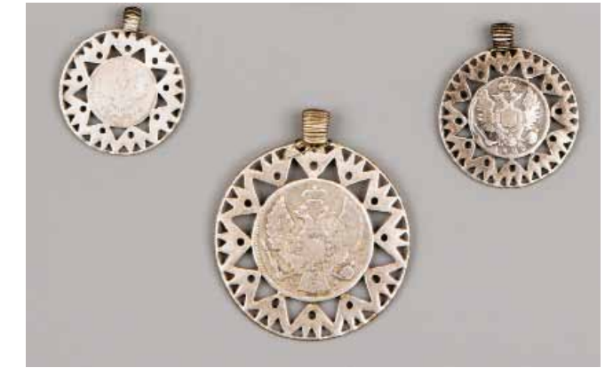
Рис. 17. Дукачи. РЭМ, 2098-28, 29, 30. Екатеринославская губ. Новомосковский у. Середина XIX – начало XX века. Серебро

двух традиций – автохтонной финно-угорской и привнесенной германской;