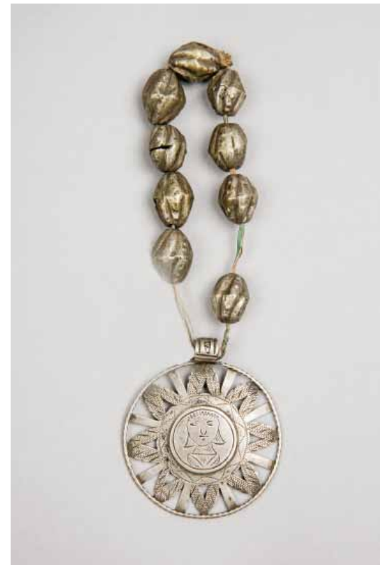
Рис. 12. Ожерелье. РЭМ, 6697-45. XIX век. Подвеска работы И.Ф. Бауманна. Монеты Российской империи – 5 копеек XIX века. Серебро