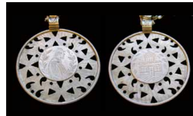
Рис. 8 а, б. Подвеска работы В.А. Трюля. РЭМ, 6697-60. XIX век Серебро