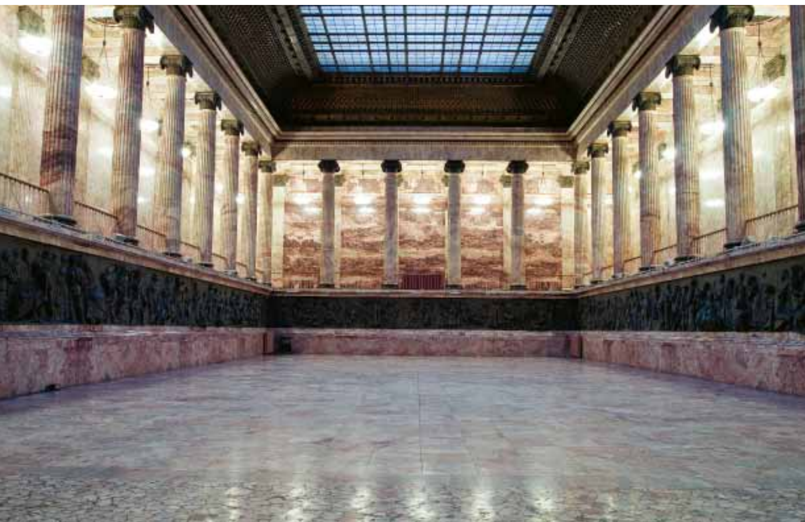
Илл. 5. Памятный зал сегодня.