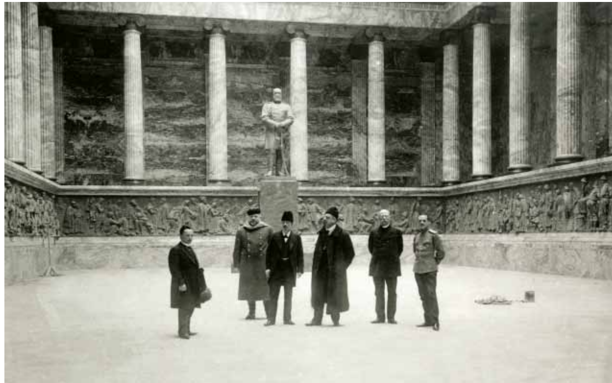
Илл. 6. Памятник императору Александру III в Памятном зале 1915 г.