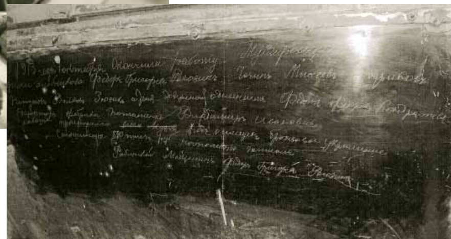
Илл. 8. Падуга с фамилиями мастеров «мундировщиков».

бронзу, а сам карниз и потолок галереи – из искусственного мрамора 28 , что и было сделано.