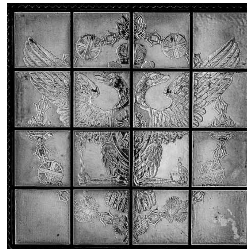
Илл. 4. Пластинки хрустального потолка с гербом Российской империи в Андреевской ленте.

графические снимки с исполненных в гипсе скульптурных изображений, состоящих из императорского герба и регалий и губернских гербов, предназначенных к установке в нишах между пилястрами Памятного отдела. По проекту В.Ф. Свиньина «...вышеуказанные скульптуры, отлитые в бронзе, являются деталями гладкой мраморной стены отдела и составляют переход к украшенным бронзой потолкам» 26 . Через год Комиссия вновь обсуждала вопрос о «...художественно-декоративных работах: постановке бронзовых канделябров..., бронзовых украшений во впадине арки, на двух, примыкающих к ней пилястрах и на впадинах стен между пилястрами, а также постановке между колоннами бронзовых со стеклом витрин и декоративно-скульптурных предметов на тетивах ступеней» 27 . Из-за отсутствия средств в бронзе были исполнены только падуга, капители и базы колонн зала. Вследствие указанных причин даже необходимые детали конструкции верхней части зала пришлось делать из разнородного материала. Так, чтобы удешевить работы, архитектор предложил три ряда орнаментальных обломков в мраморном карнизе над колоннами исполнить не в бронзе, а в белом цементе с имитацией под