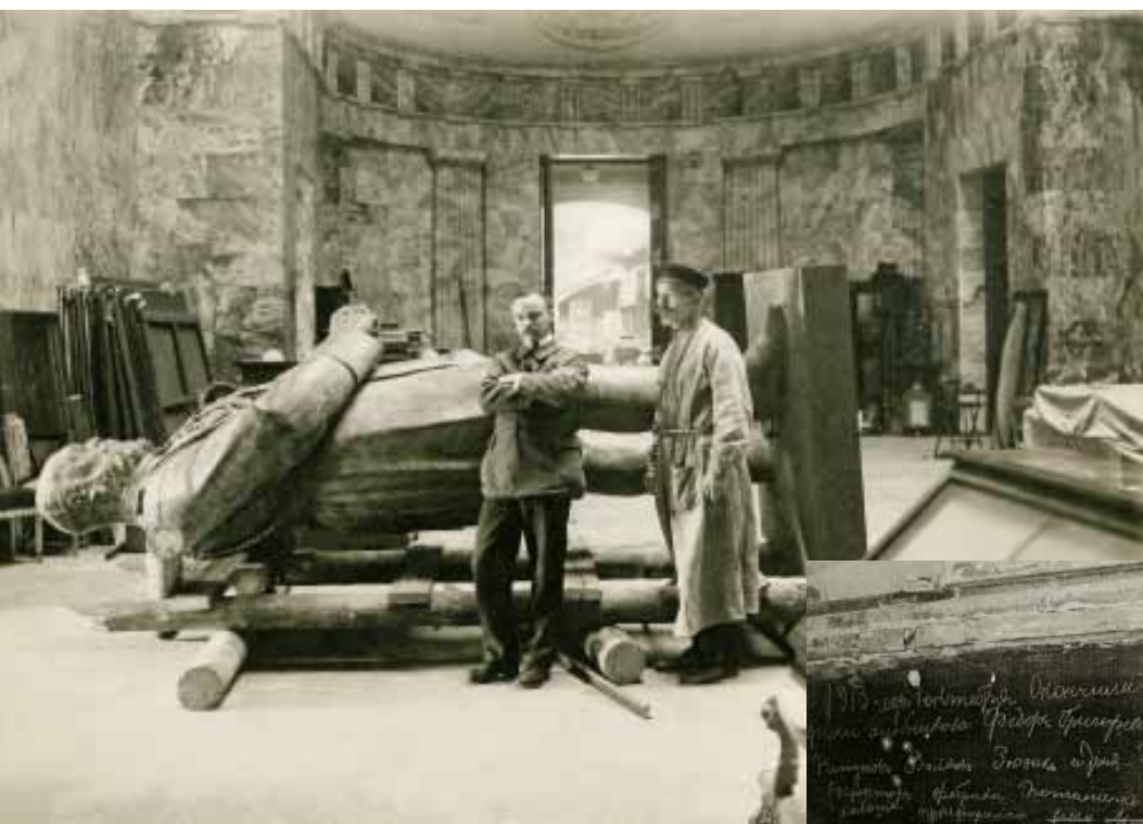
Илл. 7. Памятник Александру III в Аванзале. Архив РЭМ