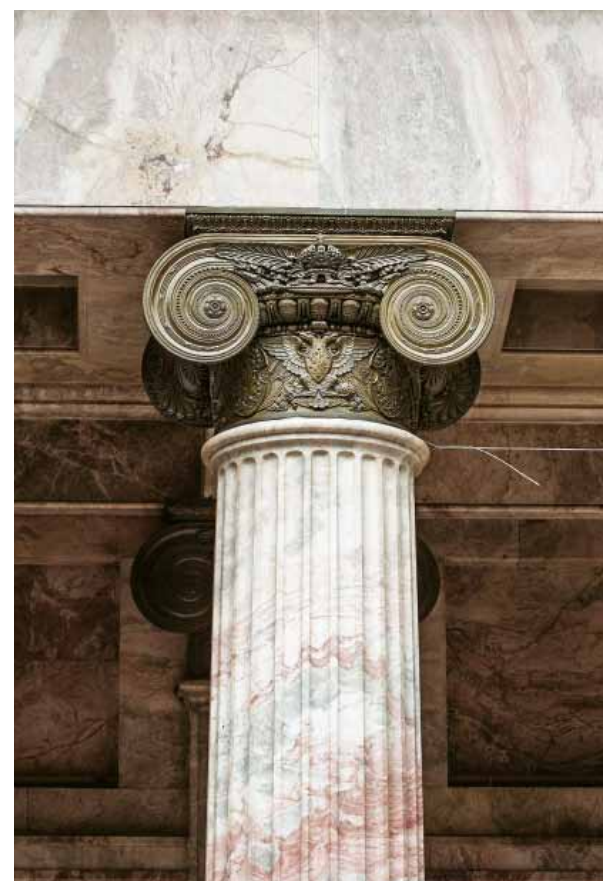
Илл. 3. Капитель колонны с гербами и монограммой Александра III.

графические снимки с исполненных в гипсе скульптурных изображений, состоящих из императорского герба и регалий и губернских гербов, предназначенных к установке в нишах между пилястрами Памятного отдела. По проекту В.Ф. Свиньина «...вышеуказанные скульптуры, отлитые в бронзе, являются деталями гладкой мраморной стены отдела и составляют переход к украшенным бронзой потолкам» 26 . Через год Комиссия вновь обсуждала вопрос о «...художественно-декоративных работах: постановке бронзовых канделябров..., бронзовых украшений во впадине арки, на двух, примыкающих к ней пилястрах и на впадинах стен между пилястрами, а также постановке между колоннами бронзовых со стеклом витрин и декоративно-скульптурных предметов на тетивах ступеней» 27 . Из-за отсутствия средств в бронзе были исполнены только падуга, капители и базы колонн зала. Вследствие указанных причин даже необходимые детали конструкции верхней части зала пришлось делать из разнородного материала. Так, чтобы удешевить работы, архитектор предложил три ряда орнаментальных обломков в мраморном карнизе над колоннами исполнить не в бронзе, а в белом цементе с имитацией под