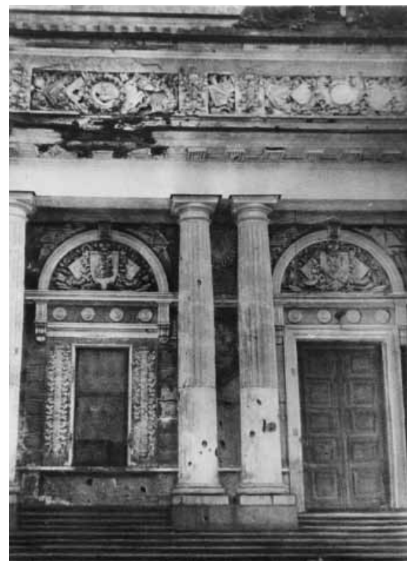
Илл. 4. Центральный фасад здания музея со следами попадания снарядов. Фотография 1943 года. РЭМ. ИМ 10-1