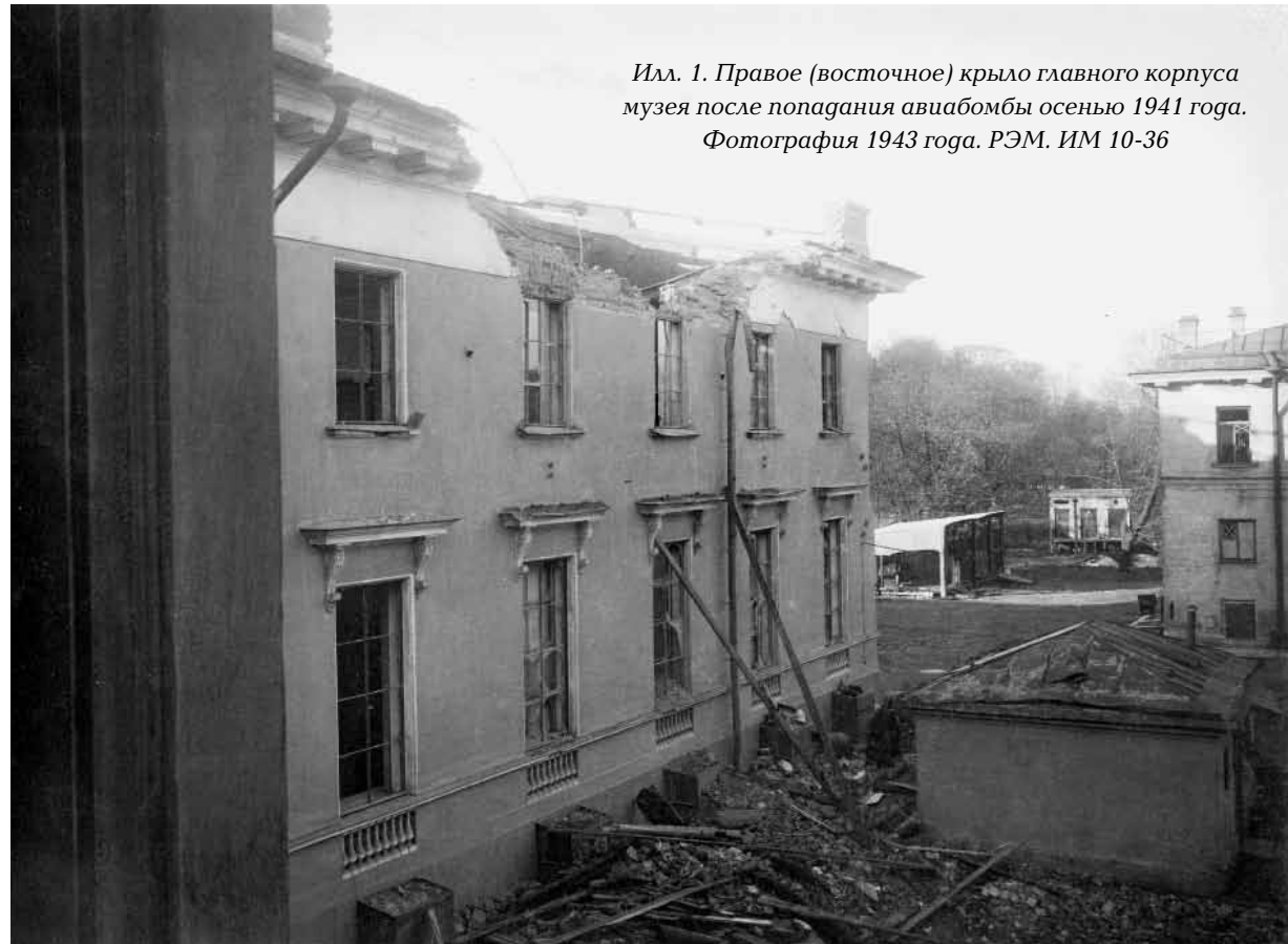
Илл. 1. Правое (восточное) крыло главного корпуса музея после попадания авиабомбы осенью 1941 года. Фотография 1943 года. РЭМ. ИМ 10-36