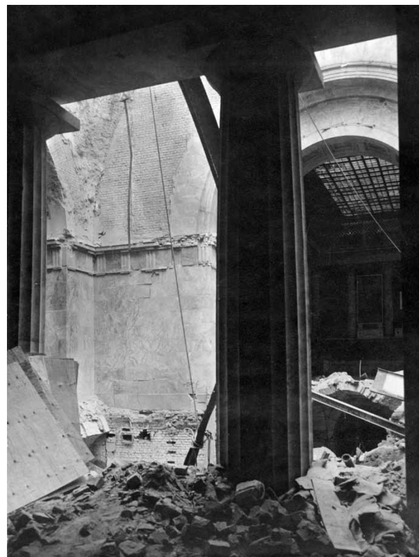
Илл. 2. Вид Аванзала после бомбежки в декабре 1941 года. Фотография 1943 года. РЭМ. ИМ10-4