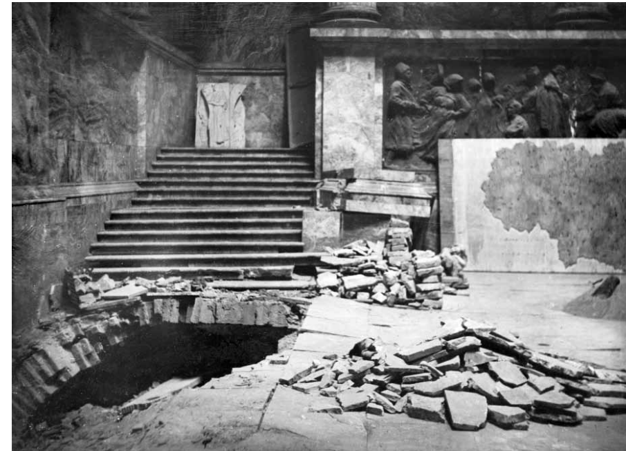
Илл. 3. Повреждения в Мраморном зале музея от попадания бомбы 5 декабря 1941 года. Фотография 1944 года. РЭМ. ИМ 10-17