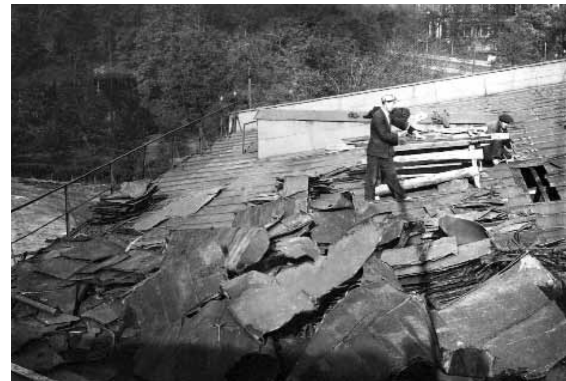
Илл. 5. Ремонт крыши музея. Фотография 1945 года. ИМ10-25