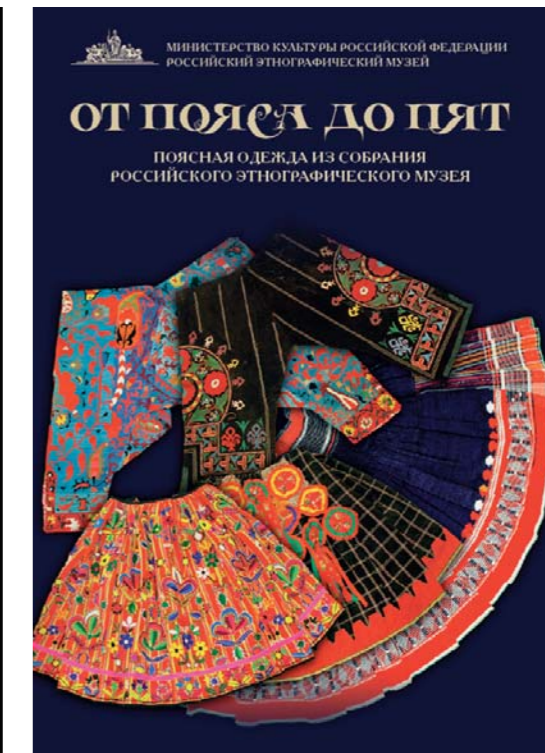
Афиша выставки «От пояса до пят». 2010

ским маркером, который давал информацию об этнической принадлежности и конкретном месте жительства владелицы костюма. На выставке были представлены два основных типа женской поясной одежды: 1) несшитый, состоящий из одного или нескольких полотнищ; 2) сшитый глухой. Изготавливали эту женскую одежду преимущественно из домашних шерстяных, полотняных или шелковых тканей, а также покупных материй фабричного производства.