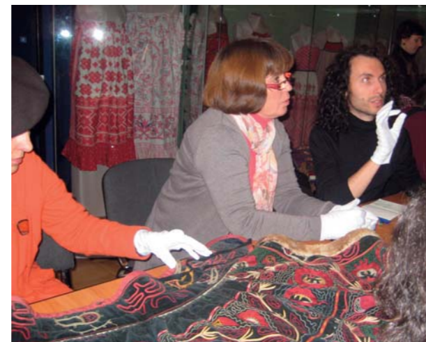
Выставочный проект «Антропология вещи». Ведущие дизайнеры одежды Санкт-Петербурга на занятиях практического семинара «Белье перчатки»

На Северном Кавказе мужской нательной одеждой, кроме туникообразной рубашки, служил распашной бешмет из шелка или хлопчатобумажной ткани с воротником-стойкой и застежкой от горла до талии. Туникообразные мужские рубашки народов Средней Азии подразделялись на распашные и глухие. В свою очередь рубашки глухого покроя имели различную