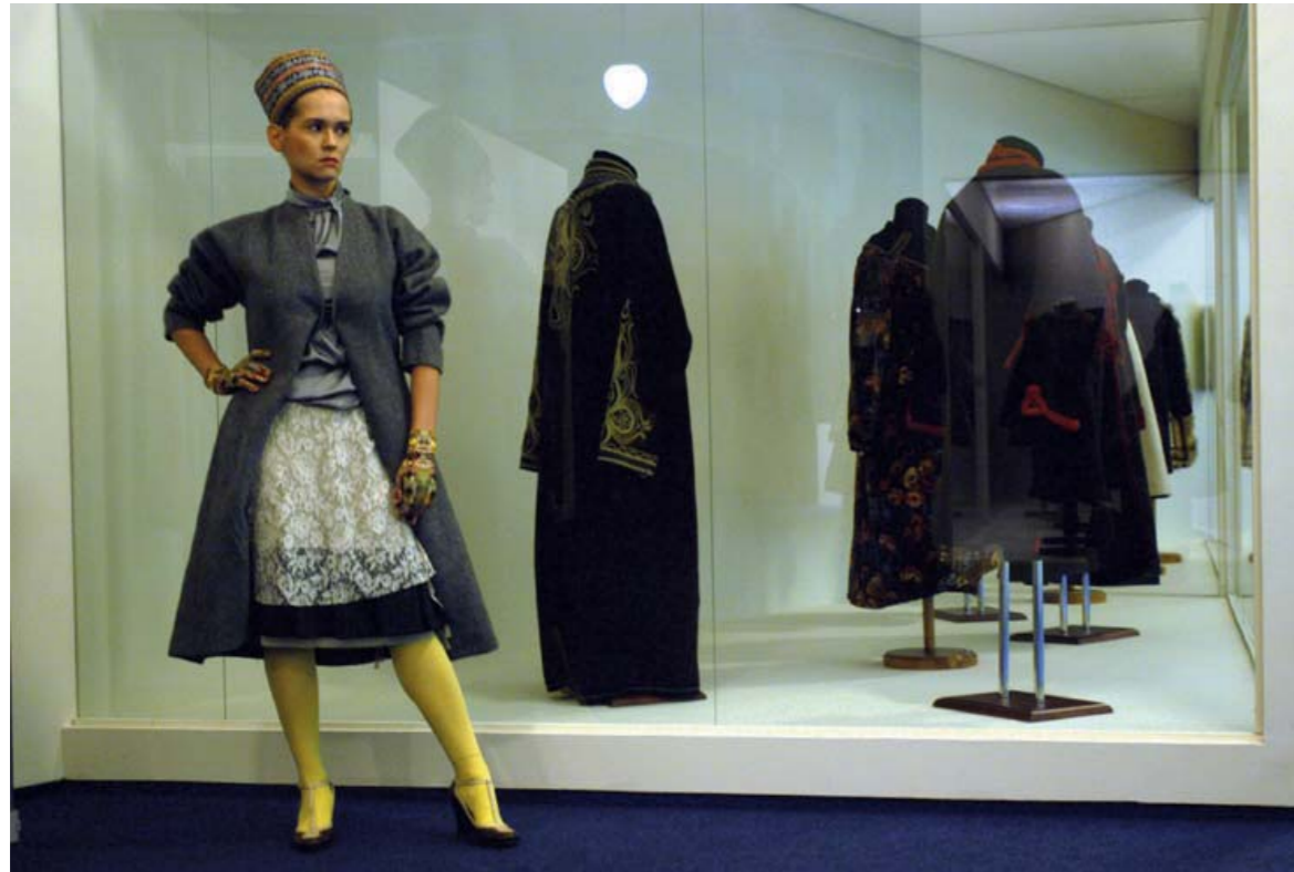
Выставка «Шубы, шубки, казакины». 2006 Перформанс с использованием моделей современных дизайнеров в сочетании с объектами из коллекции РЭМ

ства исполнения, так и их исторической ценности 3 .