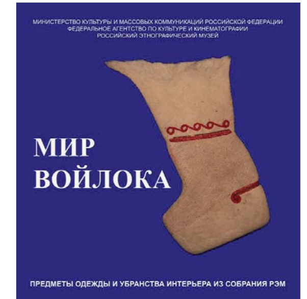
Афиша выставки «Мир войлока». 2007

У каждого народа существует собственная история использования индиго. Любопытно, что синие одежды в культуре тюркских народов часто являются облачением в обрядах жизненного цикла, будь то похороны или свадьба. Вместе с тем синий цвет воспринимался как небесный, священный, обетованный, заветный, исконно чистый, высший. В некоторых обще-