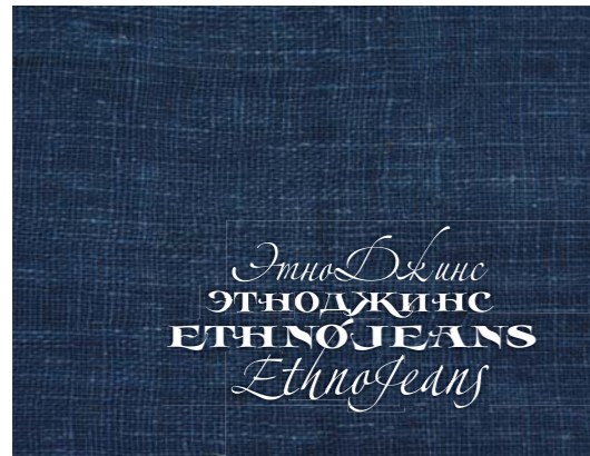
Буклет, подготовленный к выставке «ЭтноДжинс». 2008

осень–зима 2008–2009, представленными виртуально на больших LCD экранах. Выставка вызвала большой интерес, с успехом экспонировалась и явилась серьезным импульсом для создания новых моделей, о чем можно судить, анализируя модные коллекции 2009 г. 7