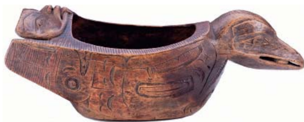
Рис. 2. Ритуальный сосуд тлинкитов, вырезанный в виде фигуры ворона. № 2539-15.

употребляем был капитаном Портлок, от Сандвичевых островов один» 24 . Здесь говорится о тлинкитском ритуальном сосуде, вырезанном в виде фигуры ворона № 2539–15 (рис. 2). По своей форме он действительно похож на ковш для воды 25 . Из цитаты следует, что у С.Г. Скотта была коллекция, собранная Натаниэлем Портлоком (1748–1817). Впервые мысль о том, что в состав собрания С.Г. Скотта входили вещи участников Третьей экспедиции Дж. Кука, высказал П.Л. Белков 26 . В дальнейшем он обосновал идею о принадлежности ряда океанийских и австралийских предметов МАЭ к сборам участников Третьей экспедиции Дж. Кука. В частности, П.Л. Белков отметил, что к предмету № 736–239 из коллекции С.Г. Скотта есть старинная этикетка с надписью на английском языке: «Throwing sticks from New Zealand» 27 . Однако имя собирателя, от которого С.Г. Скотт получил этнографическую коллекцию, П.Л. Белков не назвал.