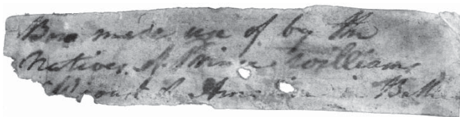
Рис. 3. Этикетка с надписью «Bow made use of by the Natives of Prince Williams... Amer... Battles» от лука № 2915-30.

Н. Портлок родился на территории британских колоний в Северной Америке, он участвовал в Третьей экспедиции Дж. Кука 1776–1780 гг. В 1785–1788 гг., командуя торговым судном «Король Георг», плавал в водах Аляски, зиму 1786–1787 гг. провел на Гавайских островах, в 1788–1793 гг. на судне «Ассистент» плавал в южной части Тихого океана и в Вест-Индии 28 .