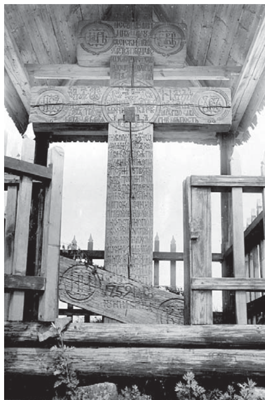
Илл. 6. Крест из г. Akhmatova Gora 1752 г.

Воспр. по: Панченко В.Б. Ладожские деревянные кресты. Рис. 9