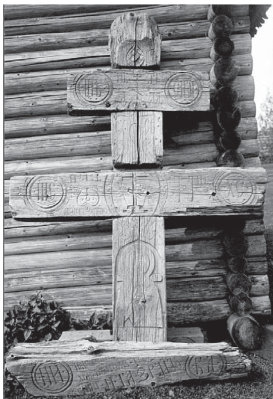
Илл. 1. Крест из г. Неважа 1626 г.

Воспр. по: Панченко В.Б. Ладожские деревянные кресты: неопубликованные материалы Н.И. Репникова из фотоархива ИИМК РАН / Староладожский сборник. — Вып. 7. — Старая Ладога, 2009. — С. 132—148. Рис. 1