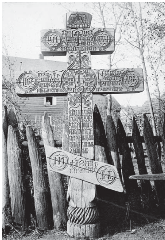
Илл. 4. Крест пог. Михаила Архангела 1690 г.