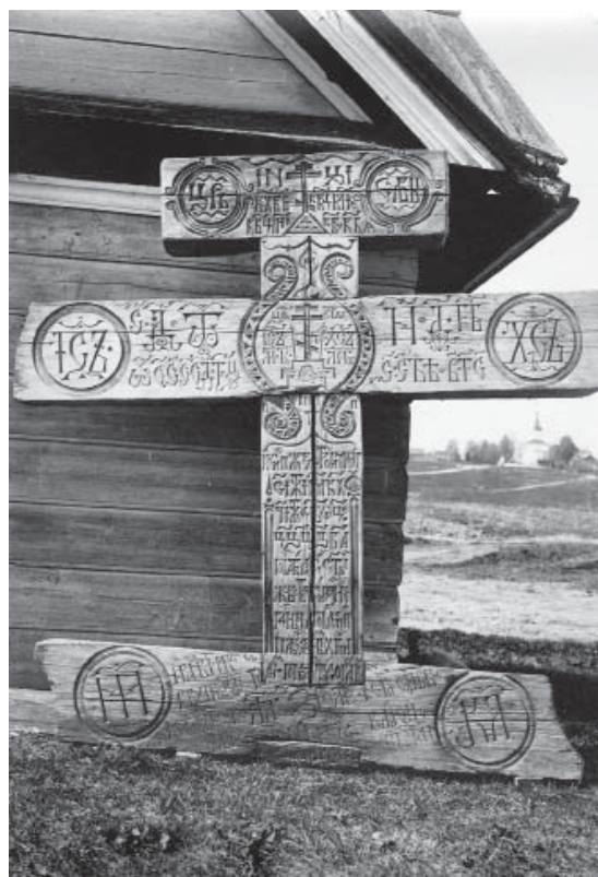
Илл. 2. Крест из г. Симонково 1663 г.

Воспр. по: Панченко В.Б. Ладожские деревянные кресты: неопубликованные материалы Н.И. Репникова из фотоархива ИИМК РАН / Староладожский сборник. — Вып. 7. — Старая Ладога, 2009. — С. 132—148. Рис. 1