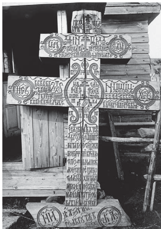
Илл. 3. Крест из г. Межумошье 1677 г.

индивидуальному обету в память о разрушенных ладожских церквях (илл. 5). Шесть крестов в 1750—1756 гг. установил уроженец Ладоги, монах и строитель Гостинопольского монастыря, Иосиф Шаров 7 . На них уже отсутствуют посвящения праздникам, а все лицевое пространство заполняется текстом «Похвалы Кресту», ранее представленным на крестах только в виде криптограмм. Неизменной остается формулировка: «ПОСТАВЛЕН СИЙ СВЯТЫЙ ЖИВОТВОРЯЩИЙ КРЕСТ ГОСПОДЕНЬ НА ПОКЛОНЕНИЕ ПРАВОСЛАВНЫМ ХРИСТИАНОМ» (илл. 6). Есть еще одно упоминание о кресте, поставленном в 1751 г. в честь освящения Троицкой церкви Гостинопольского монастыря (завершена в 1749 г.), на котором были «начертаны имена Елизаветы Петровны, ея наследника и супруги (будущих императора Петра III и императрицы Екатерины II. — В.П.), архиепископа Стефана и игумена Иосифа Шарова» 8 .