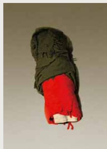
Кукла из одежды покойной (реконструкция О. Коншина) Вологодская обл., Нюксенский район, д. Пожарище Фото автора, 2009