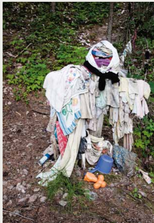
Обетный крест у Золотого ручья Покшеньга. Архангельская обл., Пинежский район 2011