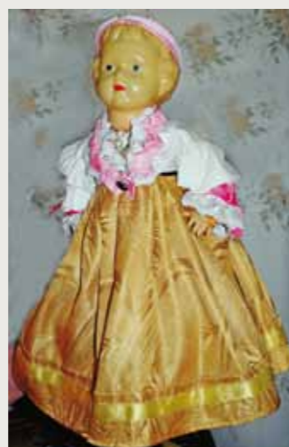
Кукла Валя (З. Евшиной) в поморском костюме Республика Карелия, Беломорский район, с. Сумский Посад. Фото автора, 2009