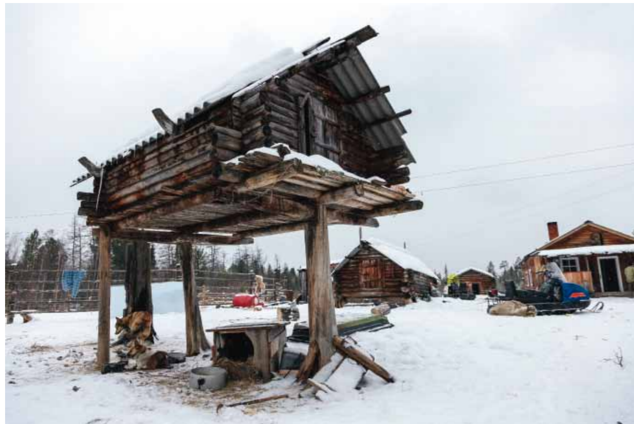
Стойбище Самбиндаловых на озере Турват. Ханты-Мансийский АО, Березовский район. Манси. 2012