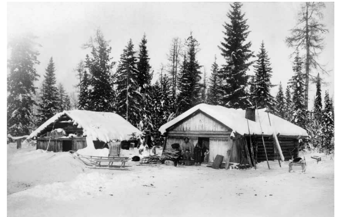
Зимнее стойбище. Тобольская губерния, Березовский уезд. Манси. 1909–1910