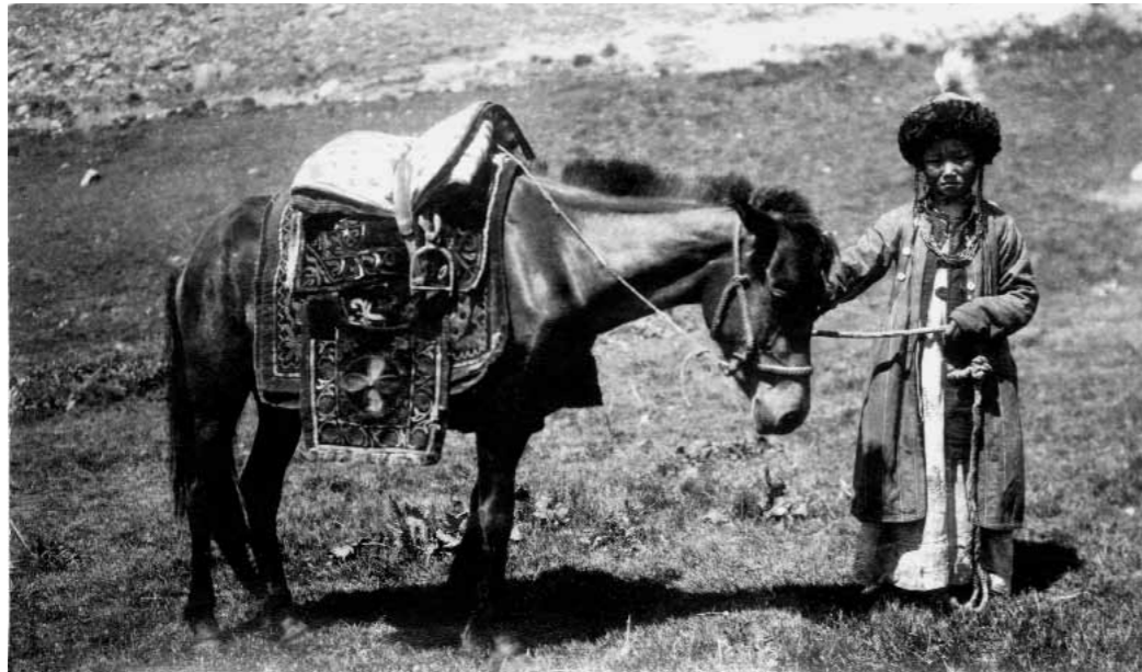
Кочевка. Алайская долина. Киргизы. 1901