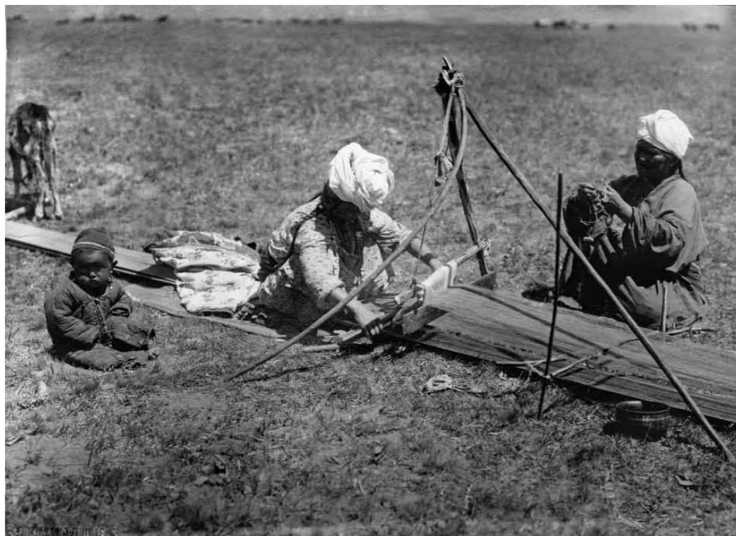
Тканье верблюжьей армячины. Алайская долина, урочище Гукдеве. Киргизы. 1901