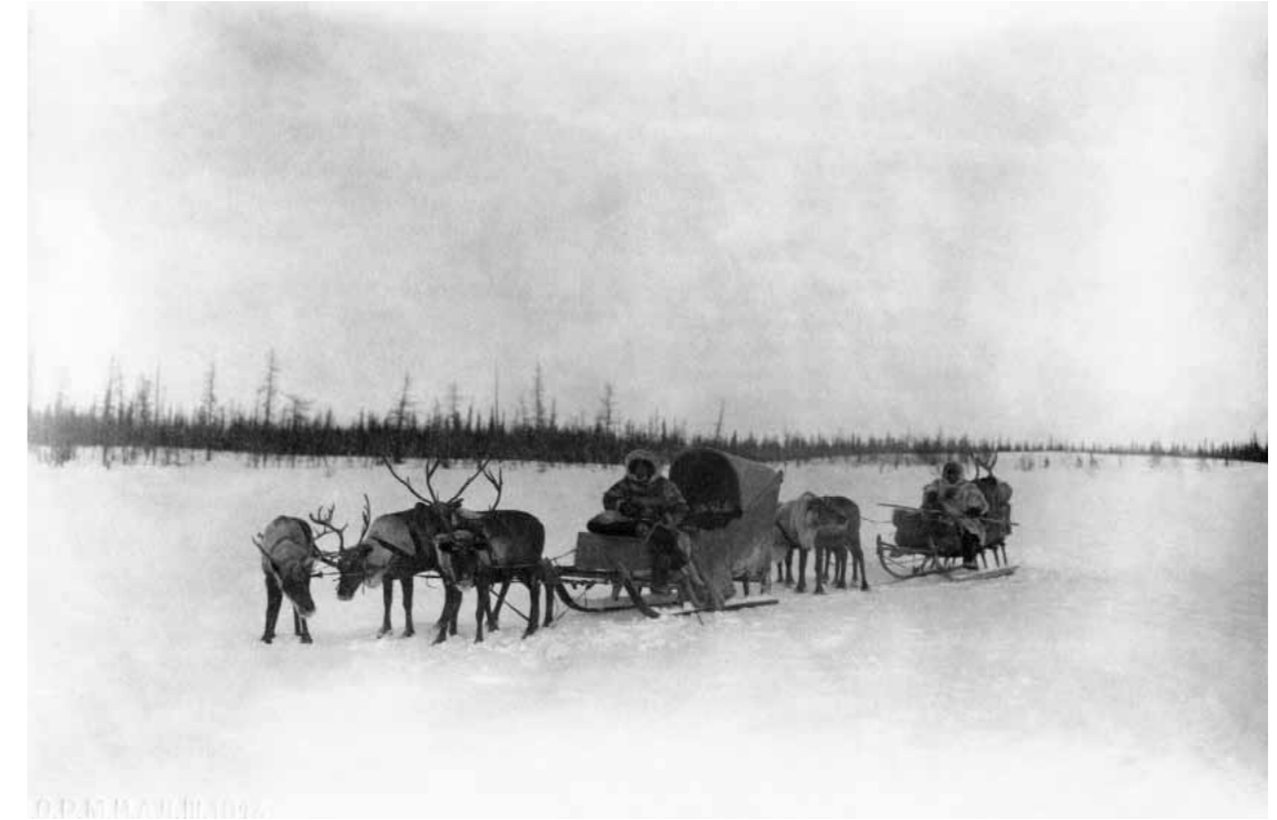
Кочевка в верховьях реки Сосьвы зимой. Тобольская губерния, Березовский уезд. Манси. 1909–1910