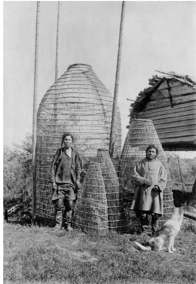
Мужчина и подросток около плетеных ловушек для ловли рыбы. Тобольская губерния, Березовский уезд. Манси. 1909–1910

добраться зимой только на буранах, а летом – на лодке или пешком через болота 18 .