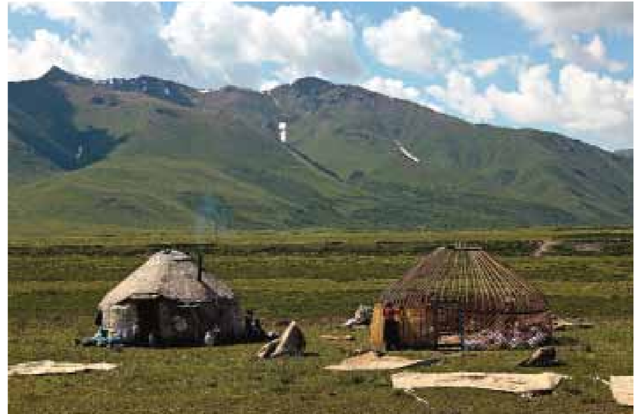
Летовка в долине реки Суусамыр. Киргизстан. Киргизы. Фотограф А.В. Жилин. 2011

(яркое солнце – тень), С.М. Дудин сообщает о необходимости приобретения еще двух объективов: широкоугольного «Цейс» серии Н № 4 или 5, а также быстроработающего для типов групп и ландшафтов «что-нибудь типа Цейса № 15» 7 .