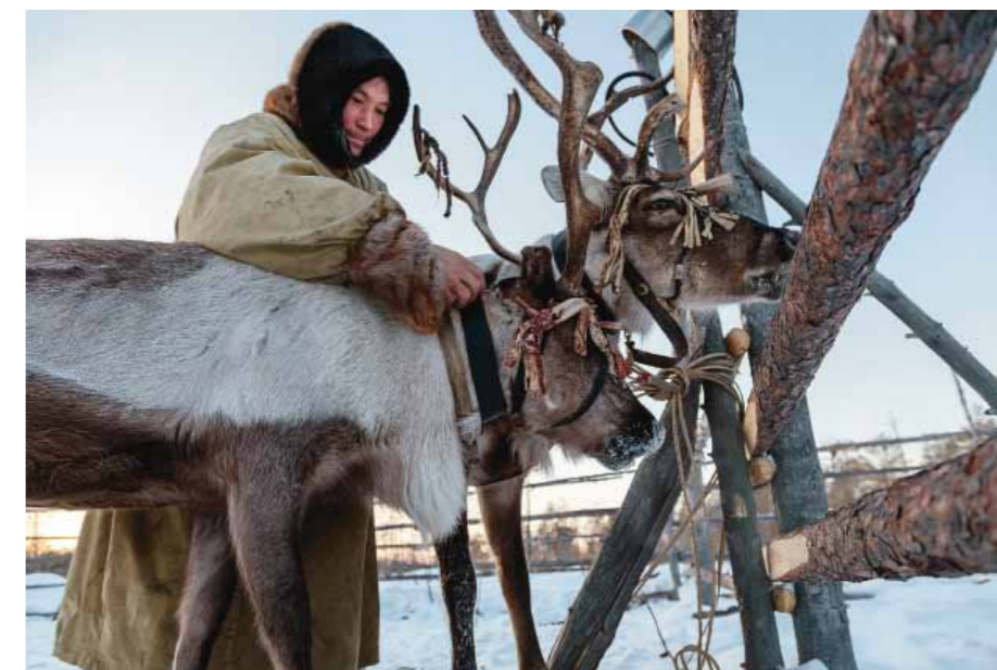
Надевание упряжи. Ханты-Мансийский АО, Березовский район. Ханты. 2012