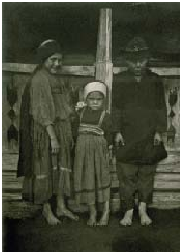
Илл. 3. Дети в «моленной» одежде. Дер. Белая, Семипалатинская губ., Бухтарминский уезд, Катон-Карагайская волость. Фотографы В.Э. Бломквист, Н.П. Гринкова. 1927. РЭМ, колл. 5573-203

Вторая часть книги — «Староверы Алтая начала XXI века» знакомит с современной жизнью потомков искателей легендарного Беловодья: в нее вошли материалы участников