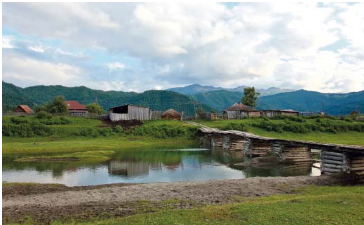
Илл. 4. Село Верхний Уймон. Республика Алтай, Усть-Коксинский район. 2010

этнографической экспедиции 2010 г. Ландшафт, поселения, домашние занятия, ремесла, обрядовые практики и, конечно, сами люди — вот те образы, которые определяют культурное пространство современных староверов. Большую часть населения в сельской местности в настоящее время составляют потомки старообрядцев, а также православных переселенцев. По наблюдениям Островского и Чувьурова, религиозные старообрядческие традиции сохраняются и ныне, но по-разному у потомков «поляков» и «каменщиков» 9 . Так, у первых имеются и православная церковь РПЦ, и церковь беглопоповцев; у вторых — также и православная церковь, и старообрядцев Белокриницкой иерархии, и несколько автономных общин беспоповцев 10 (в издании опубликованы фотографии старообрядческой церкви Белокриницкого согласия с. Замульта, а также божницы в частных домах и в моленной старообрядцев часовенного согласия). В Восточно-Казахстанской обл., у потомков бухтарминцев, имеется только старообрядческая церковь, освященная в честь свв. Петра и Павла. Построена она была несколько лет назад в с. Коробиха на территории усадьбы самой уставщицы